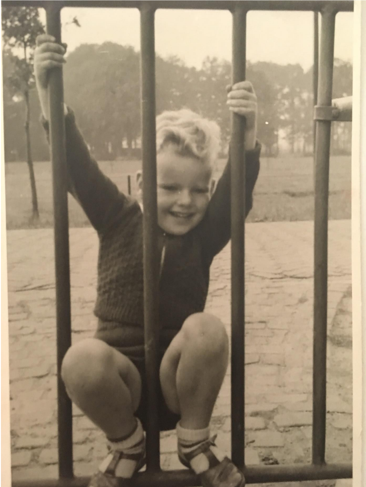
at the gate of the school ...